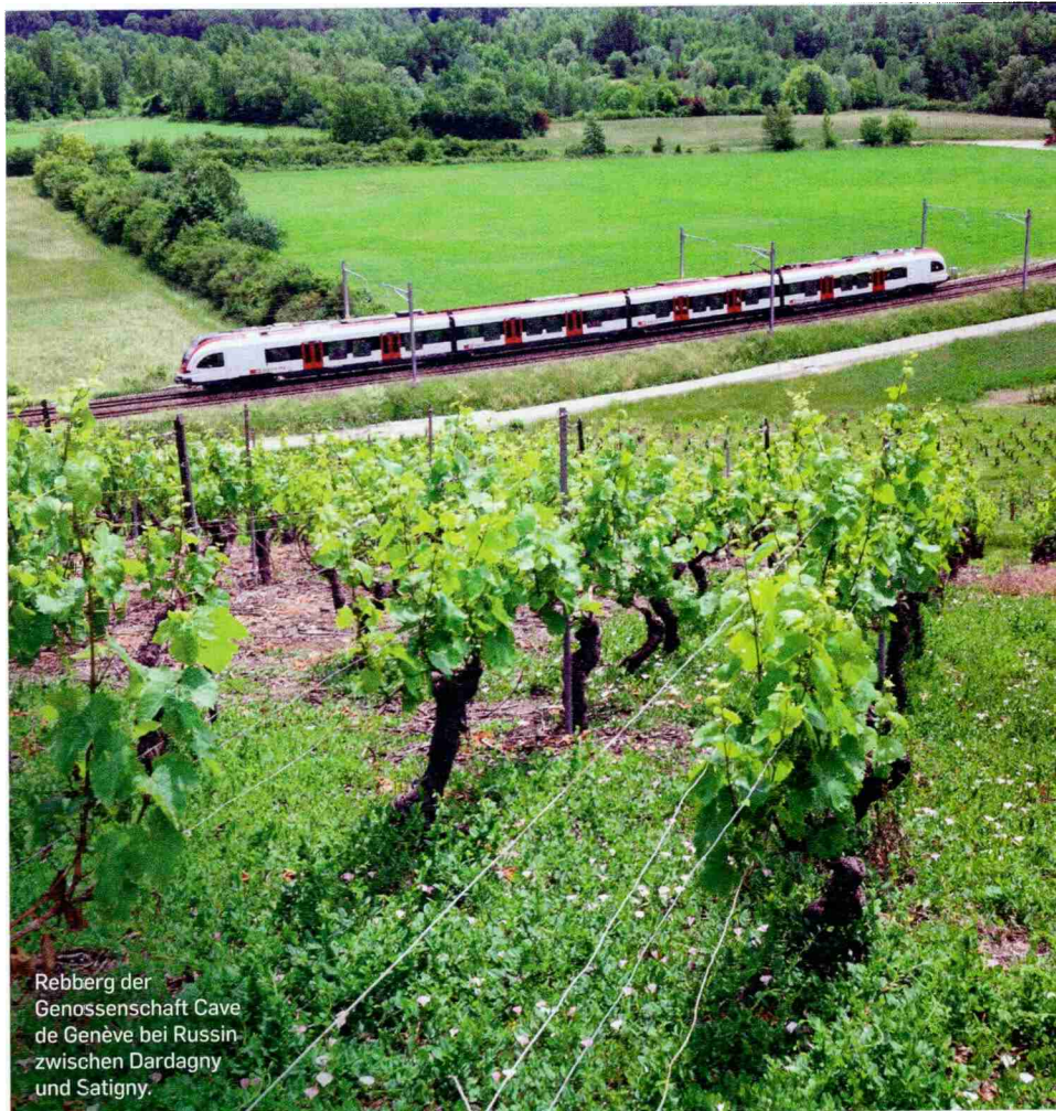
Rebberg der Genossenschaft Cave de Genève bei Russin zwischen Dardagny und Satigny.

Fotos: mauritius images / age fotostock / Danuta Hymniewska, SALVATORE DI NOLFI / Keystone / picturedesk.com, beige stellt Karte: Stefanie Hilgarth / caroline-seiler.com