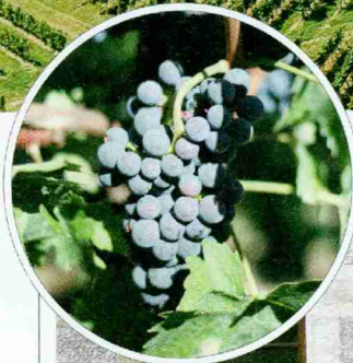
Die Rebberge der Region Genève beginnen unmittelbar vor den Toren der Stadt (o.). Die Domaine des Trois Étoiles befindet sich im Winzerdorf Satigny.