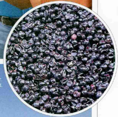
Die Domaine Les Hutins (o.) gehört zu den wenigen Genter Weinproduzenten, die über die Region hinaus bekannt sind.