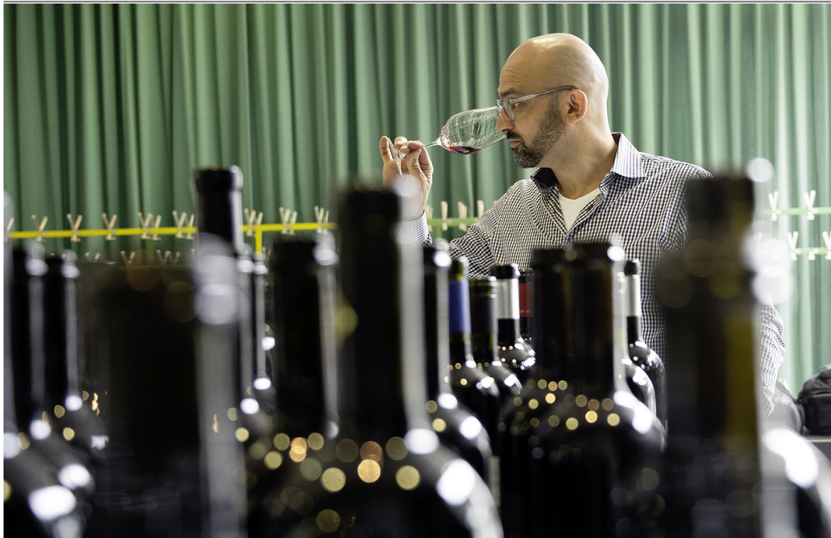
«Vintage Award»: Wie nobel reifte der Jahrgang 2013