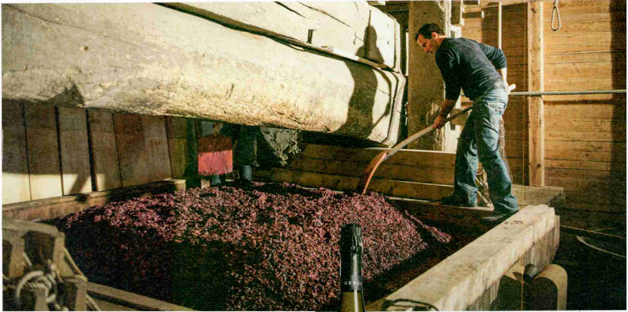
Auf dem Schlossgut Bachtobel im Thurgau (o.) setzt man auf traditionelle Methoden – bei den Stillweinen wie auch beim hauseigenen Prickler. Der Adank Brut (r.) landete 2023 auf dem ersten Platz der Falstaff-Trophy.