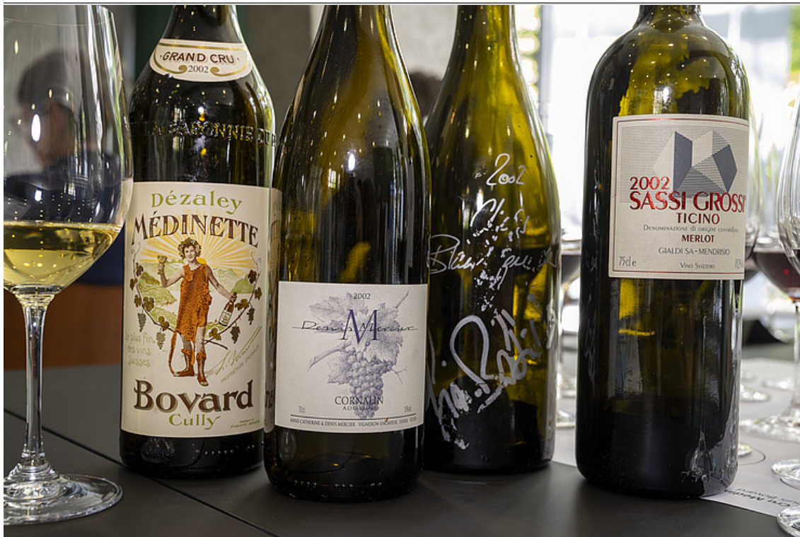
Die 2012-er Weine schneiden gut ab.